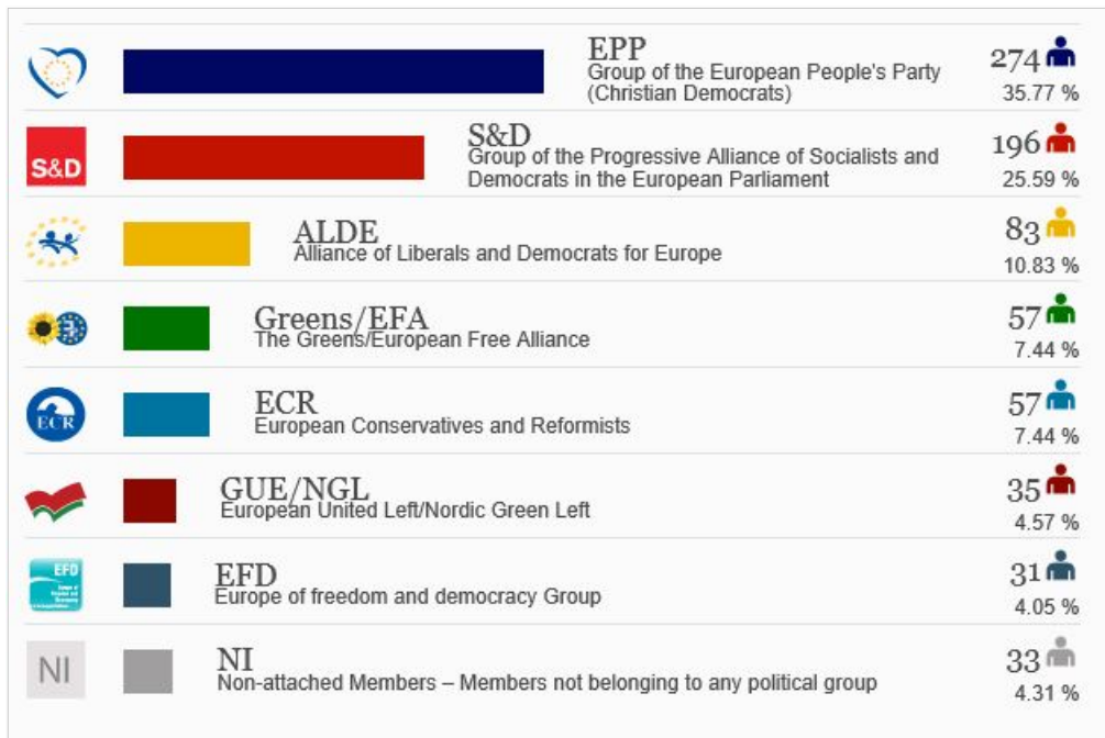
<표 4> 2014년 유럽의회 선거 결과 (투표율 43,09%, 총의석수 751석)