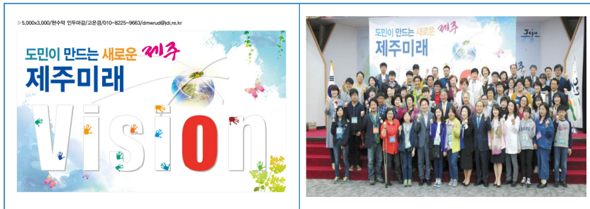
▶ 그림 1 도민계획단 회의 현수막과 전체 회의 참석자(A조) 기념사진