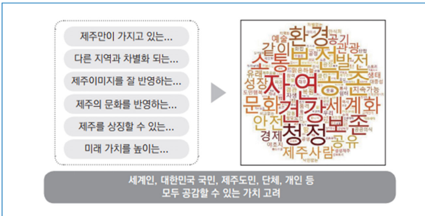
▶ 그림 4 전문가 의견조사 및 관련 계획에서 도출한 제주의 가치

연구단에서는 두 가지 방법으로 접근했다. 하나는 전문가 설문조사를 통해 가치를 도출하는 방법이고, 다른 하나는 제주도가 지금까지 수립했던 각종 계획에 나타난 키워드에서 가치를 도출하는 방법이다(〈그림 4〉 참조).