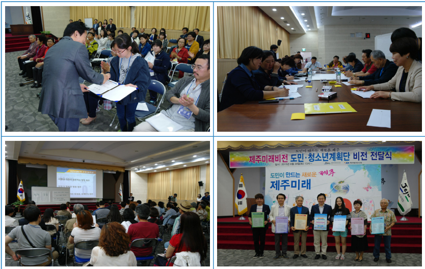
▶ 그림 2 도민계획단 위촉식, 회의 모습, 비전 전달식 전경

6) 서울, 수원 등의 경우 참석률이 35% 정도인 점을 감안하여 제주의 경우 참석률 60% 달성을 목표로 하였다.