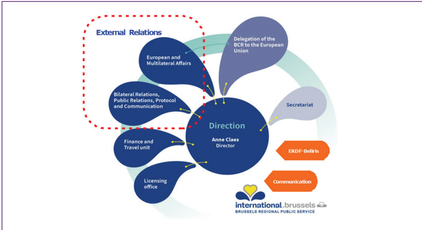
그림 2 브뤼셀 인터내셔널의 7개 Unit: