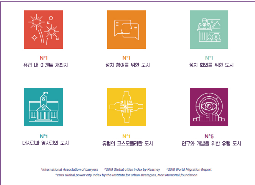
▶ 그림 4 브뤼셀 수도 지역의 국제화 순위