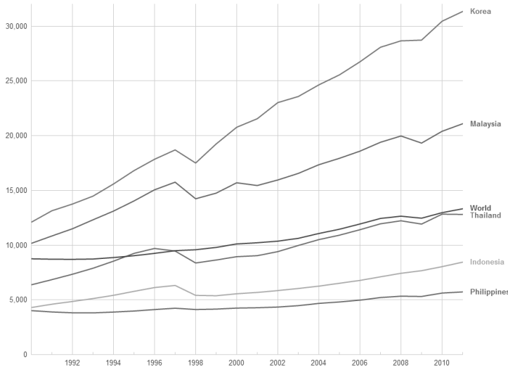
〈그림 1〉 1인당 GDP