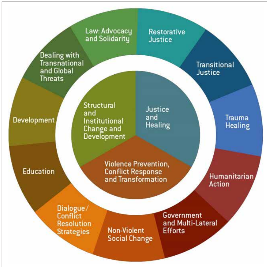
〈그림 2〉 전략적 평화의 구성요소

* 출처: 노트르담 대학교 'KROC 국제평화연구소' < https://kroc.nd.edu/about-us/what-is-peace-studies/what-is-strategic-peacebuilding/ >(검색일: 2021.9.30.).