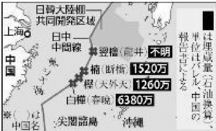
그림 2 <중일 중간선과 가스유전 문제>